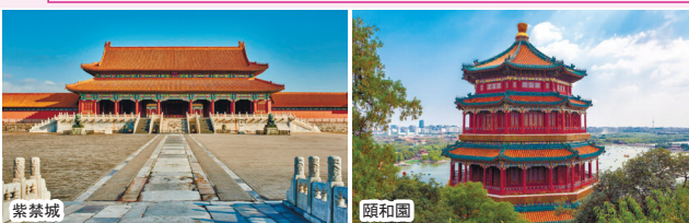
※写真はすべてイメージです 旅行企画・実施/ツアーシステム株式会社