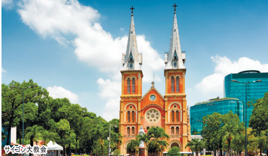
サンジョゼ大教会

※日本申込限定 ※出発2週間前までにお申し込み下さい オプショナルツアーは1名様につき手配料1,100円を含んだ金額でご案内しています。 取消の際は手配料金はお返し出来ませんので予めご了承下さい。変更の際は、都度手配料を申し受けます。取消料: 14日前より100%