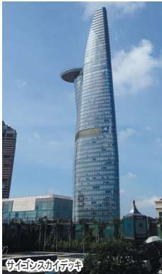
ビットエックタワー