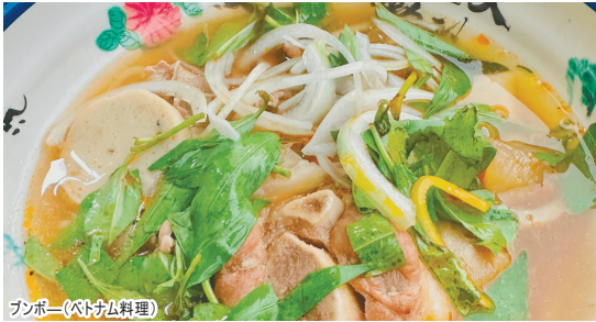
フンボー(ベトナム料理)