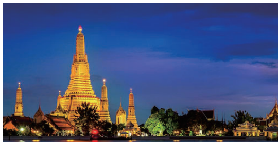
ワットアルン(夜景)

小松発バンコクフリー4日間パイオニアパティックホテル2名一室利用大人お一人様 ※燃油サーチャージを含みます