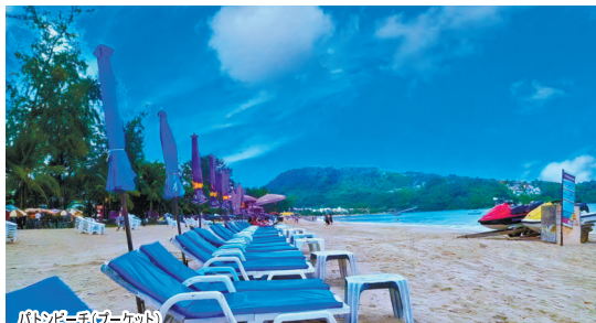
ビーチ(プーケット)

出発地・滞在期間に合わせて催行日が異なります。あらかじめご確認下さい。※出発地/帰着地は同一空港です